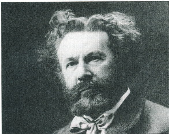
Nicolas Camille Flammarion francia sci-fi író és tudós

Flammarion magánobszervatóriumot is létesített, majd megalapította a Francia Csillagászati Társaságot. Gyakorta utazott léghajóval, amikor is a magasban meteorológiai megfigyeléseket végzett. A kutatásairól és nézeteiről egyre több könyvet írt, amelyek nagyon népszerűek lettek