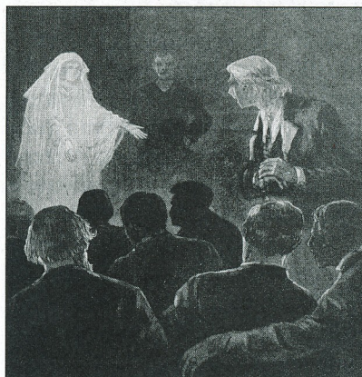
Az író megbízhatatlannak találta a szeánszok médiumait

„ A marquise egy este Párizsban egyik barátjánál ebédelt. Igen sokan voltak a vendégek, s nagyon vidámak. Egy fiatal leány nagyot sikoltott, s elkezdett hevesen zokogni. Mindenki odasietett, hogy segítsen rajta. A leány azt mondta: Ott! Ott megjelent az anyám! Húsz perc múlva csöngettek, és kérésték a leányt, hogy azonnal menjen haza, mert otthon nagy szerencsétlenség történt, az anyja hirtelen meghalt. ”